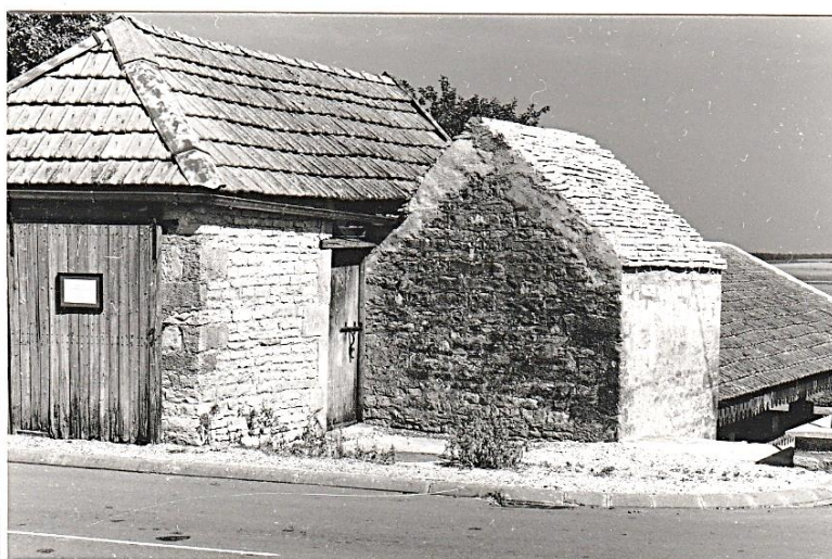
L'existence de notre panneau est signalée sur le lavoir