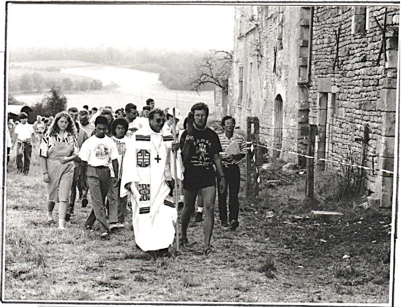
On se dirige vers le calvaire

Dans l'abbaye, ils ont préparé un spectacle pour raconter leur périple avant de se quitter sur le lieu même où le futur abbé de Clairvaux a choisi de fonder la 2 e fille de Citeaux.