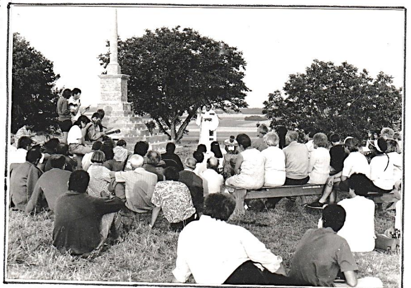
Vigiles autour du calvaire de Jully