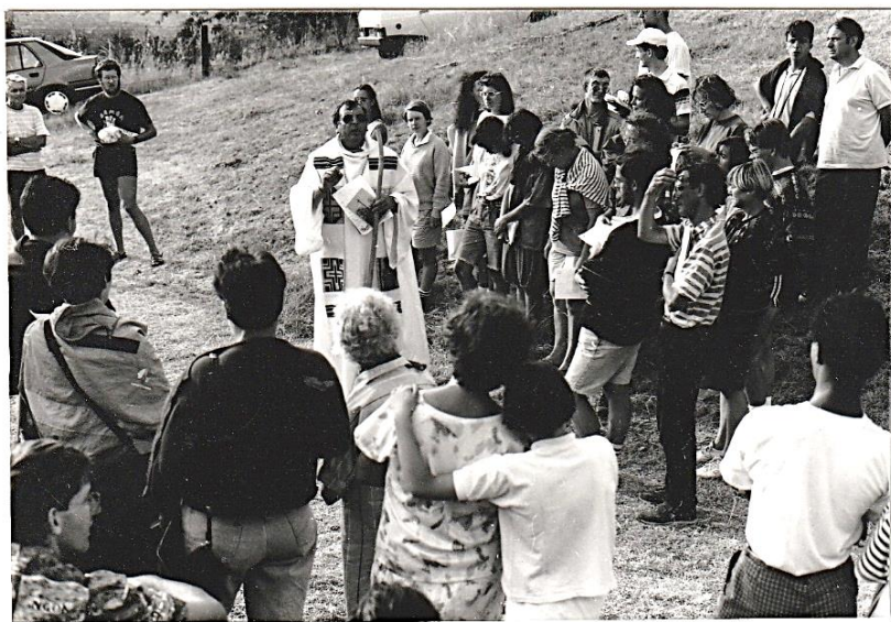
"nous sommes là pour vous connaître..."