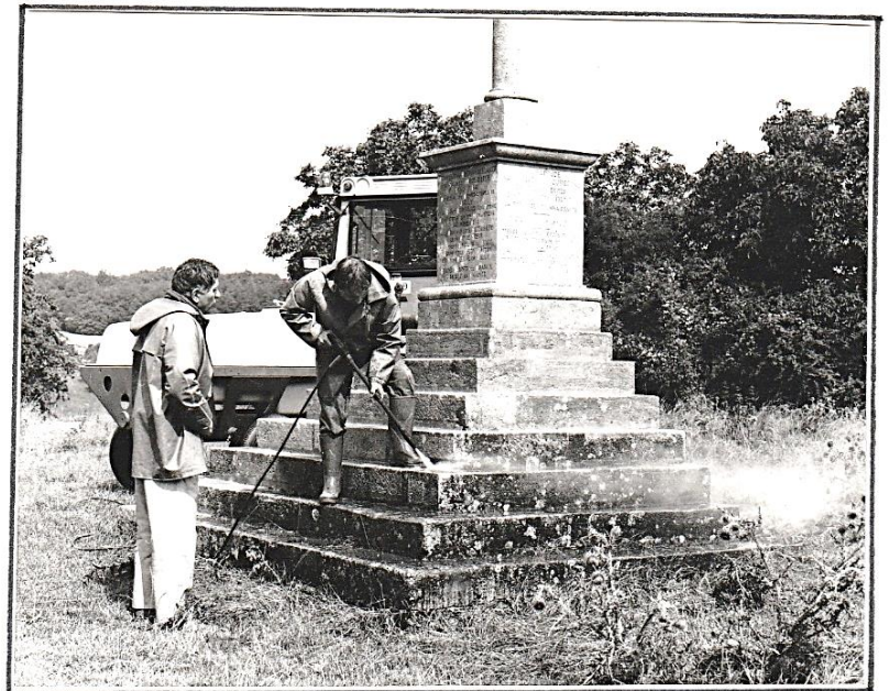
Au calvaire commémoratif de la butte (30.6.90)