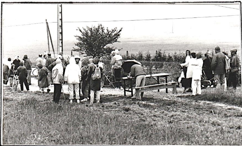
Rassemblement pour le départ de notre rallye à 8 h 30, le 8 juillet ; il pleut !

Enfin les résultats purent être proclamés et ce fût l'équipe appelée "Japon" qui remporta ce rallye avec 670 points sur 930. La deuxième équipe "Sahara" collecta 648 points et la dernière "Hollande", 390.