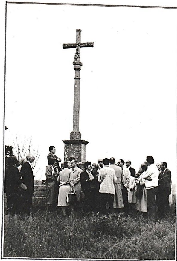
...et auprès du calvaire

-l'abbaye d'Auberive, cistercienne fondée en 1135, reconstruite au 18 e S. -les églises S t Nicolas et S t Vorles à Châtillon-sur-S, où S t Bernard fit ses études.