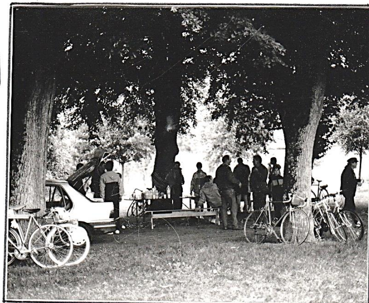
Pause des cyclistes sous les arbres du pâtis à Ravières ; jeux, casse-croute, et surtout nécessité de se sécher !

Si quelques questions ont fait la différence, de nombreuses autres étaient plus faciles et l'ensemble fût sans doute apprécié.