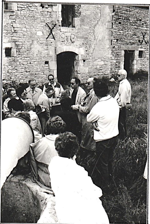
Commentaires historiques pour les membres de la SFAY devant le château

-le site de Grancey-le-château où d'après la tradition Bernard convertit une partie de son entourage.