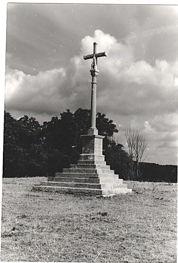
Le calvaire en août 1990

Le calvaire vient avec 6 autres d'être nettoyé au cours de cet été 1990.