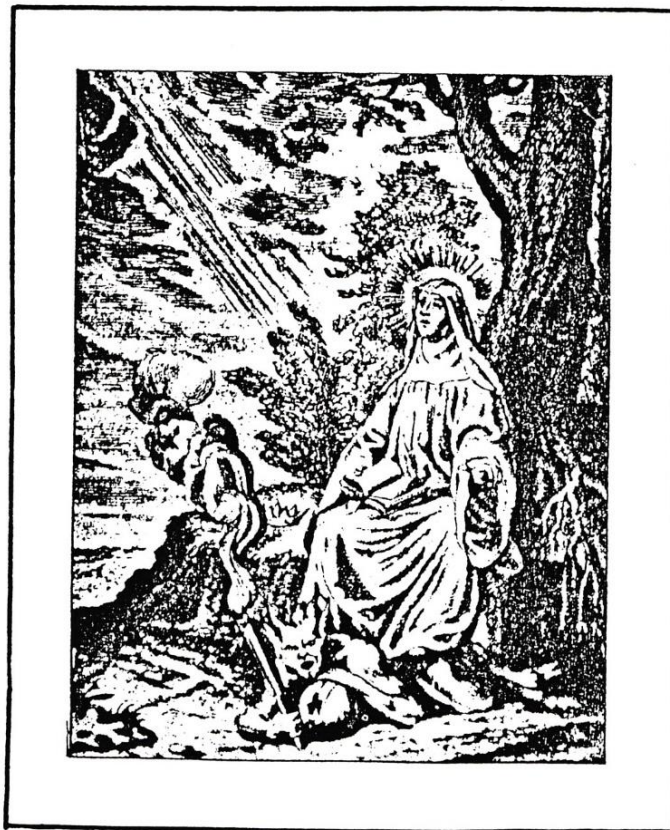
Sainte Hombeline méditant (d'après une gravure du XVII e siècle)

- M.C., Vie de Sainte Hombeline, prieure de Jully, protectrice de la région, 1945 (avec quelques poèmes de l'abbé Patriat).