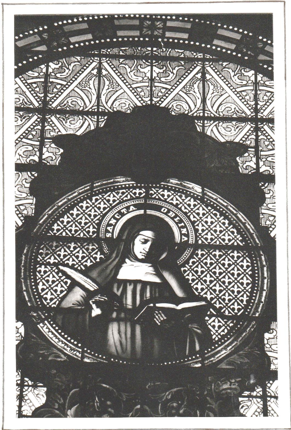
Sainte Hombeline (Vitrail de l'église de Jully)